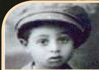
תולדות חייו | עמ' 2