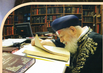
פעילותיו | עמ' 3