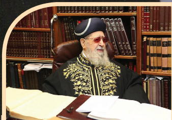
השקפתו | עמ' 4