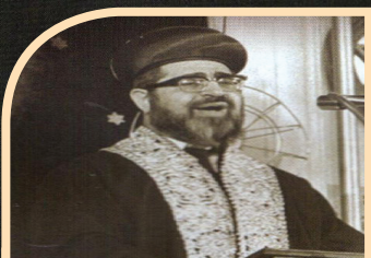
ספריו | עמ' 5